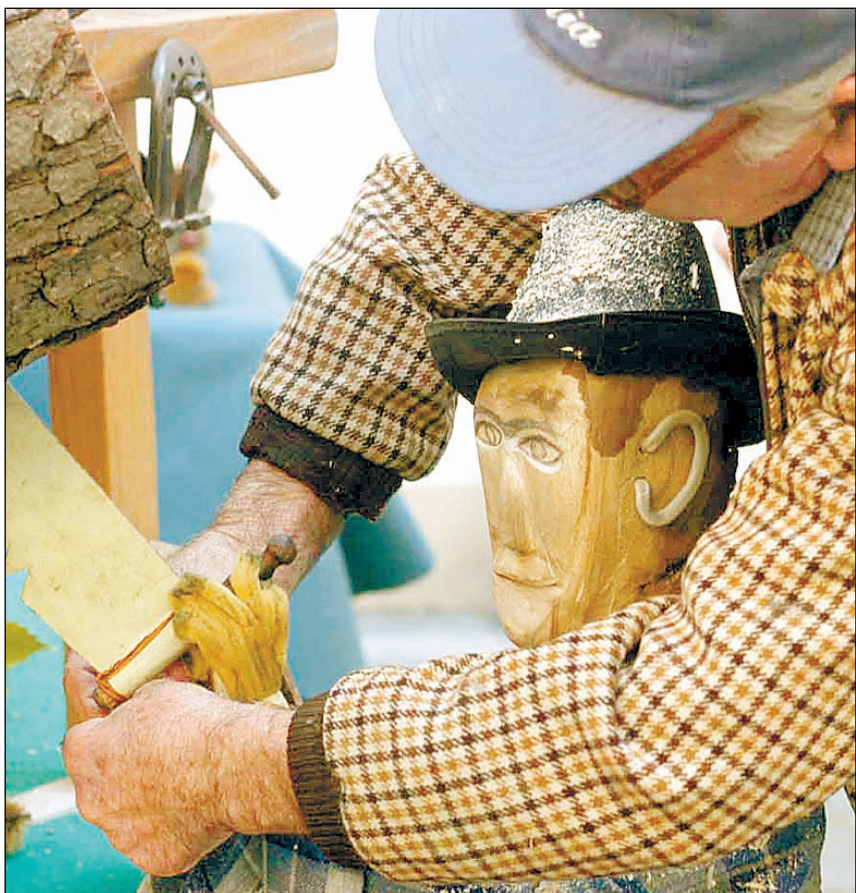
Alcuni momenti della Fiera Fredda, appuntamento immancabile da quasi mezzo secolo per i cittadini di Lugagnano e per tutti gli amanti e i frequentatori delle sue splendide colline

programmi di Paolo Limiti , e, alle 17, con le premiazioni della rassegna "Vetrine d'autunno" e del Palio delle Botti che si è tenuto, per il secondo anno, ieri e che ha visto in prima linea coppie locali che hanno letteralmente "spinto" lungo le vie del paese pesanti botti da vino, da piazza Castellana alla sede del Municipio, per poi tornare ancora in piazza.